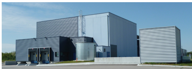
Usine de Blyes (01)

En 2014, l'entreprise s'offre un virage stratégique en ciblant les secteurs cosmétique, vétérinaire et alimentaire grâce au lancement de son 3 ème site à Blyes, dans le parc industriel de la plaine de l'Ain.